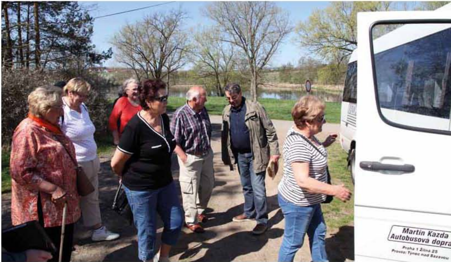
Skupinka účastníků Cesty domova 2018 – výprava směřovala na Podbrdsko-Příbramsko