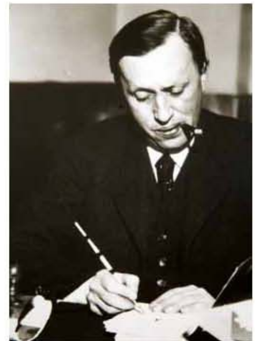
Spisovatel a novinář Karel Čapek